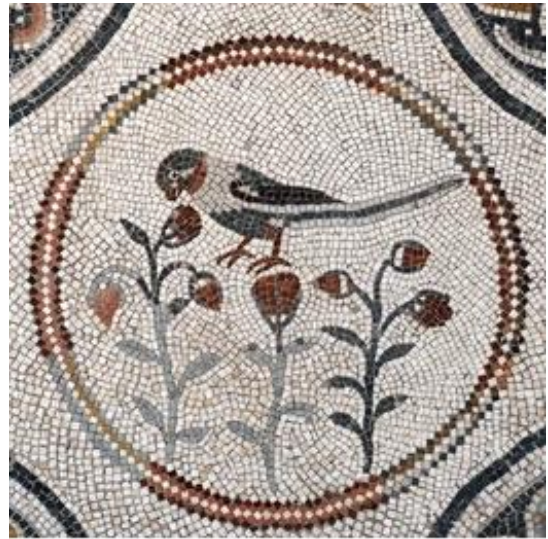
FRAGMENTOS DE MOSAICOS ANTIGUOS