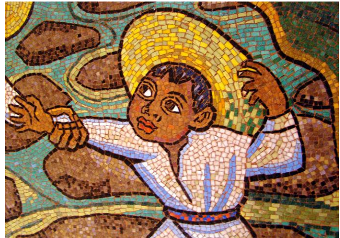
FRAGMENTOS DE MOSAICOS MEXICANOS