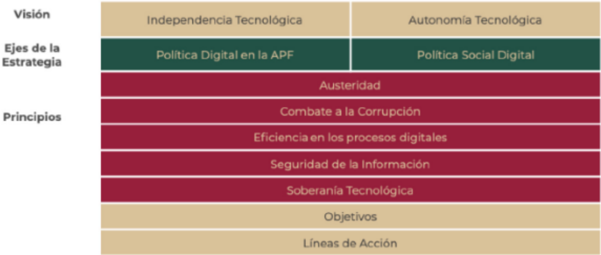
Figura 3. Marco estructural de la EDN

La siguiente figura esquematiza dicho marco estructural: