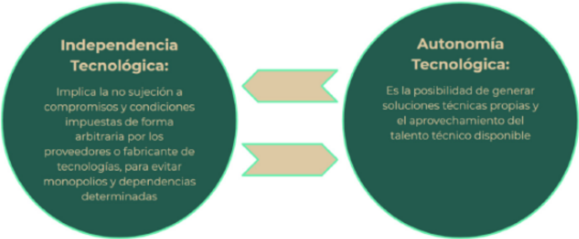
Figura 2. Visión de la EDN

La estrategia que se presenta desglosa la estructura bajo la cual se establecen dos ejes de acción y se formulan objetivos generales y específicos que orientan el ámbito y alcance de la política pública y se detonan las principales líneas de acción para lograr una transformación digital y tecnológica a nivel nacional.