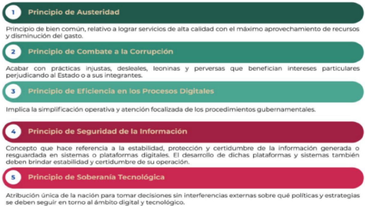
Figura 1. Principios de la EDN

La EDN aterriza las capacidades gubernamentales en la prioridad de atender los planteamientos de una adecuada gobernanza tecnológica, la mejora de los servicios digitales y la optimización de los procesos, enmarcando dichos propósitos en los siguientes principios: